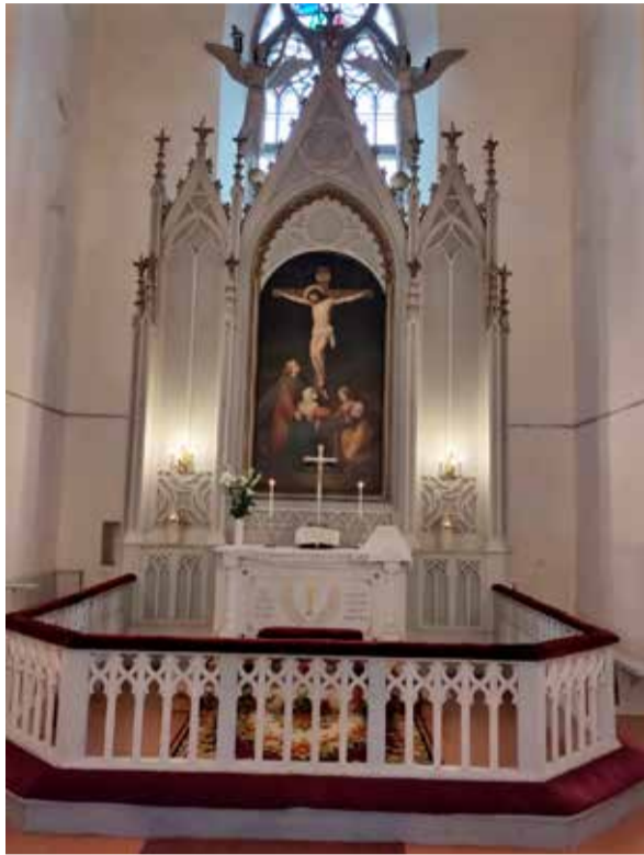
Tarvastun kirkon alttari.