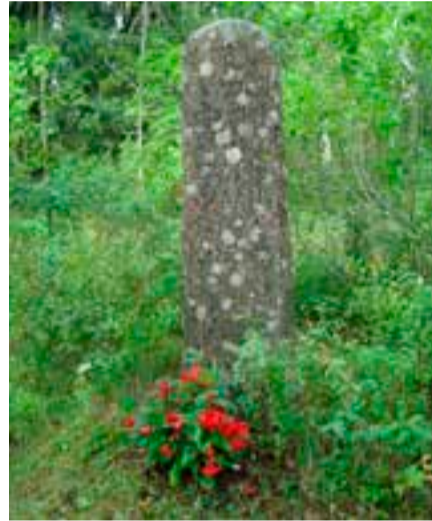
Laidikkeen muistokivellä Suomusjärvellä pidetään jumalanpalvelus heinäkuussa.