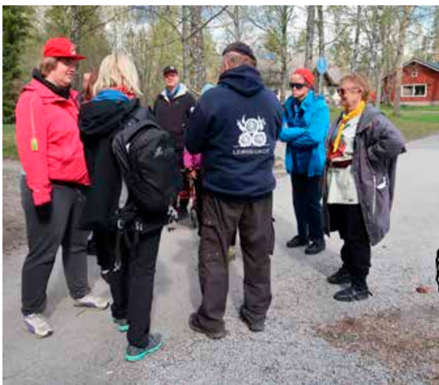
Partiokisassa kierrettiin omassa ryhmässä erilaisia rasteja ja ratkaistiin tehtäviä.

Sisupartion sammakkomerkki on kansainvälinen. Siinä on jalussolmu kuvaamassa paksumman köyden ja ohuemman köyden yhdessä muodostamaa vahvaa solmua. Jalussolmun keskellä on sisukkuudesta kertova sammakko. Sisutarina kertoo, kuinka kaksi sammakkoa tipahtivat kerma-astiaan. Toinen sammakoista koki nesteen oudoksi uida, luovutti ja hukkui. Toinen sammakko räpiköi, räpiköi ja räpiköi kunnes kerma muuttui voiksi, jonka päältä sammakko pääsi hyppäämään pois astiasta ja pelastui.