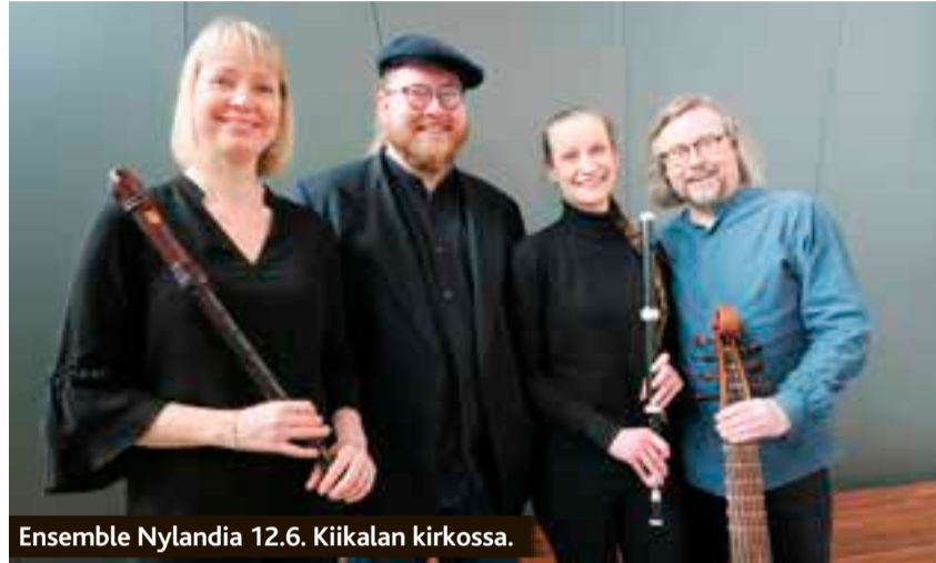
Ensemble Nylandia 12.6. Kiihkalan kirkossa.