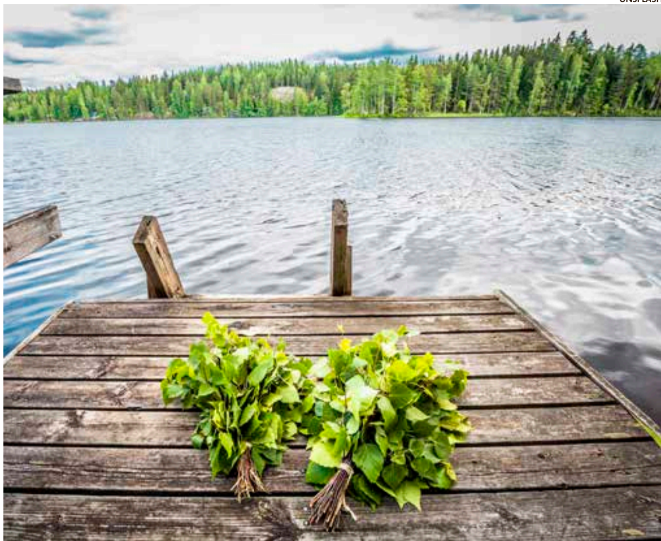
Seurakunnan leirikeskuksissa lämpiävät saunat jälleen kesällä. Tervetuloa viihtymään yksin, kaverin tai koko perheen kanssa!

Naarilan rantasaunalla on mahdollisuus viettää kesäiltaa kolmena heinäkuun ja kolmena elokuun iltana. Muistiin kannattaa laittaa seuraavat ajankohdat: ma 4.7. * ti 12.7. * ma 25.7. * ti 2.8. * ti 16.8. * ti 23.8. Sauna on lämpimänä klo 17–20. Nuotiopaikka (metsäpalovaroituksen salliessa) ja grillikota ovat käytettävissä; paikoilla voi