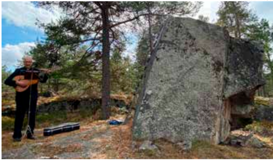
Angelniemen kirkkovahalla on hartaus elokuussa.