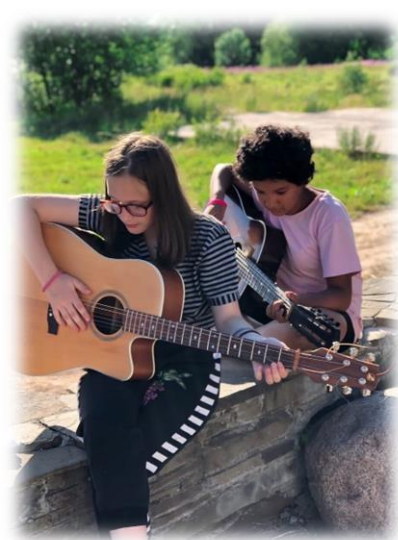
Kuvat vuoden 2020 kesäleiriltä