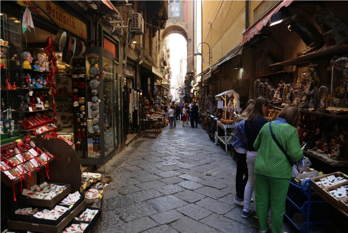
Napoliin keskustan katu on täynnä seimi-kauppoja.