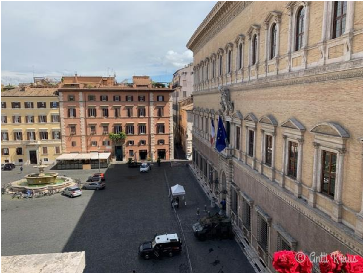
Näkymä Birgittalaisluostarin terassilta piazza Farneselle ja palazo Farnese. Roomassa olemme 3 vuorokautta.