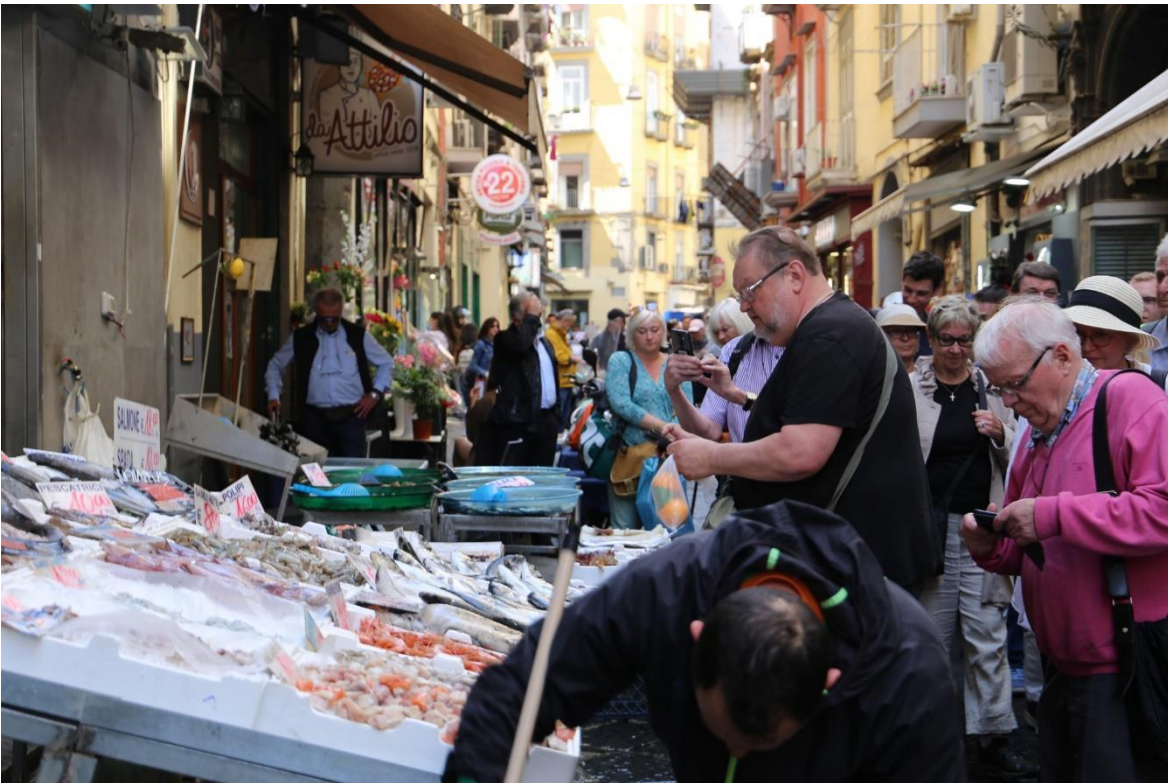
Napoliin Espanjalainen kortteli.