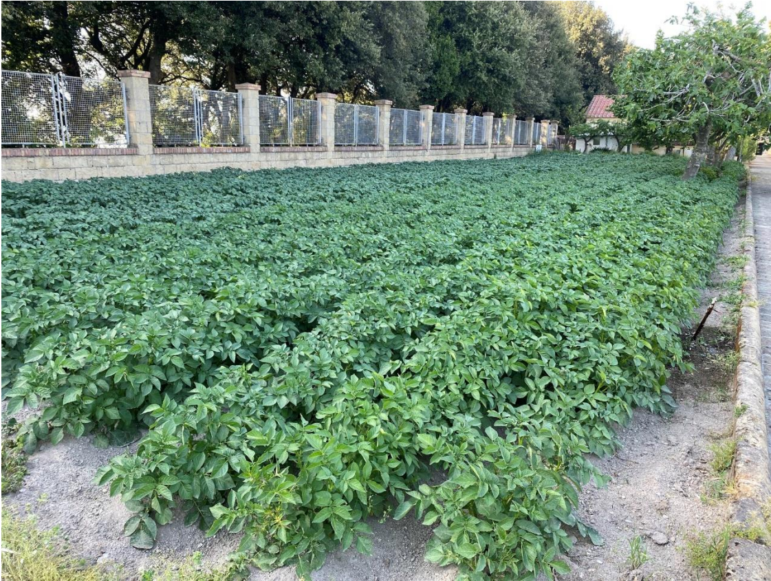
Luostarin omaa perunasatoa.