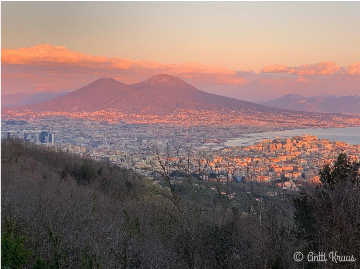
Näkymä birgittalaisluostarista Napolin keskustaan. Taustalla Vesuvius.

Matkan kohteina ovat tällä kertaa Napoli ja Rooma . Majoitumme aluksi Birgittalaisluostariin eräällä maailman kauneimmalla paikalla, Camaldolin kukkulalla , joka on 485 metriä merenpinnan yläpuolella. Sieltä avautuvia maisemia on ylistetty maailman kauneimmiksi. Luostarin alue on noin viiden hehtaarin kokoinen. Siellä viljellään vihanneksia, hedelmiä ja viiniä. Luostari oli aiemmin Camaldolimunkkien käytössä. Domenico Fontana suunnitteli luostarin ja se rakennettiin vuonna 1585.