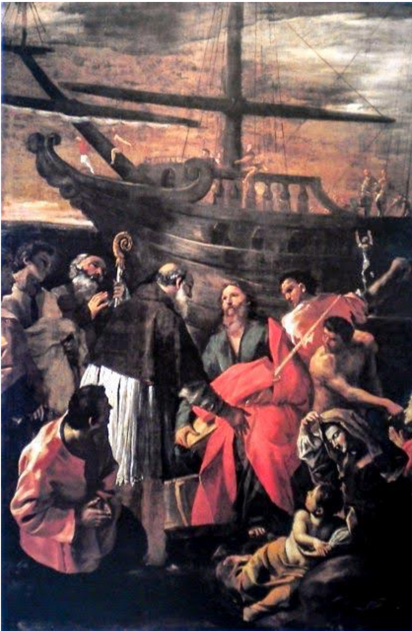
Paavalin saapuminen Pozzuoliin. Giovanni Lanfrancon maalaus.

To 21.11. bussi vie meidät Puteoliin (nykyinen Pozzuoli), johon apostoli Paavali rantautui merimatkaltaan (Ap.t. 28: 13). Lounaan jälkeen käymme Ercolanon kaupungissa, joka tuhoutui Vesuviuksen purkaantumisessa. Siellä paikallinen opas selostaa, mitä v. 79 j.Kr. tapahtui ja millaista oli elämä antiikin aikaisessa kaupungissa.