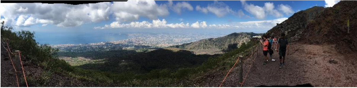
Napoli ja Napolin lahti Vesuviukselta nähtynä.

Matkan kohteina ovat tällä kertaa Napoli ja Rooma . Majoitumme aluksi Birgittalaisluostariin eräällä maailman kauneimmalla paikalla, Camaldolin kukkulalla , joka on 485 metriä merenpinnan yläpuolella. Sieltä avautuvia maisemia on ylistetty maailman kauneimmiksi. Luostarin alue on noin viiden hehtaarin kokoinen. Siellä viljellään vihanneksia, hedelmiä ja viiniä. Luostari oli aiemmin Camaldolimunkkien käytössä. Domenico Fontana suunnitteli luostarin ja se rakennettiin vuonna 1585.