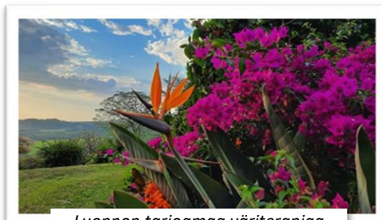
Luonnon tarjoamaa väriterapiaa

Viime syksynä kyselin teiltä aiheita, joista haluaisitte kuulla kirjeissäni. Eräs kysymykseeni vastannut oli kiinnostunut erityisesti jostain maallisemmasta asiasta, joka kannattelee minua tai josta saan voimaa, joten siitä seuraavaksi. Joku ehkä saattaakin muistaa viime vuodelta innostukseni pyöräilyyn. Kotimme läheisyydessä pyöräilymaastot ovat pääasiassa olleet asfalttiteitä, mutta onneksi kohtuullisen matkan päästä löytyy myös hiekkateitä polkemista silmällä pitäen. Kaikenlainen luonnossa liikkuminen onkin voimaannuttavaa. Kenialainen luonto on niin monimuotoinen ja kaunis, että maisemat voivat hengästyttää ilman raskaampia liikuntasuorituksiakin. Luonnon helmassa arkinen aherrus unohtuu ja saa hengitellä puhdasta