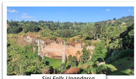
Sipi Falls Ugandassa

Oman lisänsä viime vuoteen toi myös kotimaankauteni. Suomessa vierähtäneet neljä kuukautta olivat erilaista aikaa. Seurakuntavierailut, perheen ja ystävien kanssa vietetty aika sekä asioiden