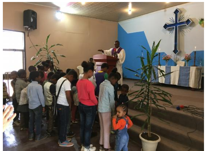
Mekane Yesus kirkon jumalanpalveluksessa pappi siunaa lapset pyhäkouluun.

Sunnuntaiamuna pääpiispa pyhitti veden, jota suihkutettiin ihmisten päälle, ja lopuksi samanlaisessa kulkueessa katuja pitkin – koko ajan laulaen tai tanssien – kopiot vietiin kirkkoihin takaisin. Juhla yhdistää kaksi Vanhan testamentin tapahtumaa Daavidin (1 Aik. 15 ja 16) ja Salomonin (2 Aik.5) aikana. Valkoisiin kansallisiin juhlapukuihin puettujen ihmisten määrä oli käsittämätön. – Pohjoisessa tutustuimme 800 vuotta vanhoihin kallioon tehtyihin kirkkoihin.