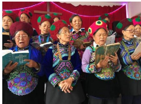
Vasemmalla: Yi vuoristokansan tapaminen Keskellä: Kangrongin kylän seurakunnan kuoro Oikealla: Kangrongissa jaettiin seurakunnanvieraille matkakeväksi keitettyjä kananmunia