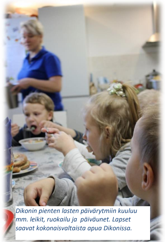
Dikonin pienten lasten päivärytmiin kuuluu mm. leikit, ruokailu ja päiväunet. Lapset saavat kokonaisvaltaista apua Dikonissa.