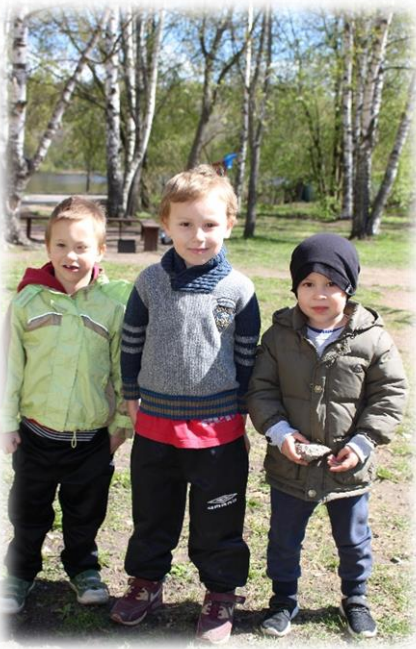
Dikonissa lapset saavat suojaa, huolenpitoa ja rakkautta.

Kummina olet korvaamaton! Kiitos Sinulle että olet mukana kummina auttamassa ja tukemassa Dikonin suojakotia, jossa apua tarvitsevat lapset ja perheet saavat apua Viipurin alueella.