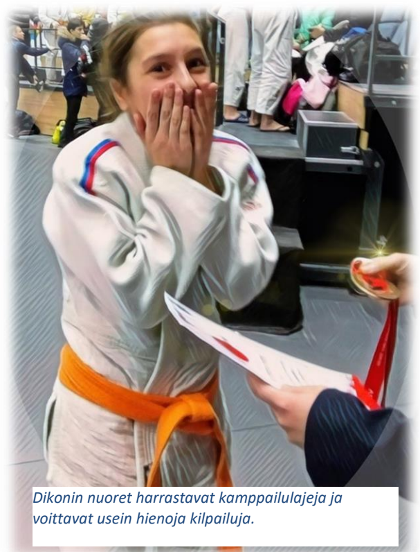
Dikonin nuoret harrastavat kamppailulajeja ja voittavat usein hienoja kilpailuja.

Dikoniin tulee jatkuvasti avunpyyntöjä perheistä ja lapsista, jotka ovat avun tarpeessa. Lyhyessä ajassa viime syksynä 6 lasta sai paikan Dikonista. ”Meille soitti perheenäiti kauemmalta Venäjällä ja pyysi että huolehtisimme kahdesta hänen vanhimmista lapsistaan, koska hänellä ei ollut mahdollisuutta pitää heitä. Siitä, mitä hän meille kertoi, ymmärsimme heti, että tilanne on kriittinen ja jo seuraavana päivänä lähdimme sinne ja kaksi uutta poikaa saapui Dikoniin. Toinen pojista tottui nopeasti uuteen tilanteeseen ja oli oma itsensä ja muut lapsetkin ottivat hänet vastaan kuin veljen. Järjestimme kouluasiat ja hän aloitti koulun, hän alkoi käydä myös harrastuksissa. Toinen poika tarvitsee paljon tukea ja kuntoutusta. Meidän täytyy etsiä vaihtoehtoja, mikä koulu sopisi hänelle ja olemme jo käyneet monissa erilaisissa neuvotteluissa. Hän tarvitsee tällä hetkellä paljon esirukouksia.”