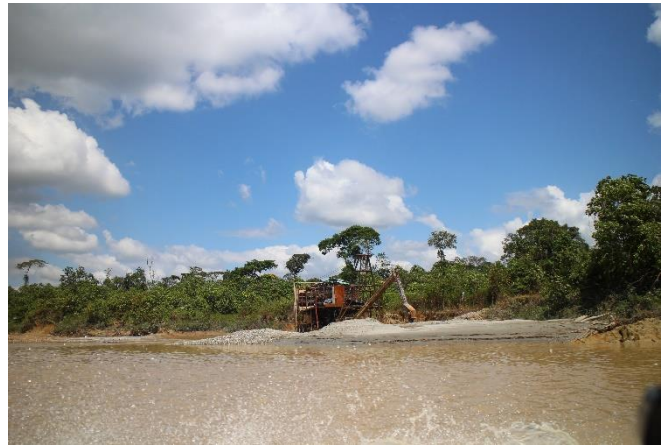
Laitonta kullankaivua Atrato-joella