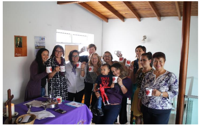
Naistenpäivänä Kolumbian lut.kirkossa Medellinissä