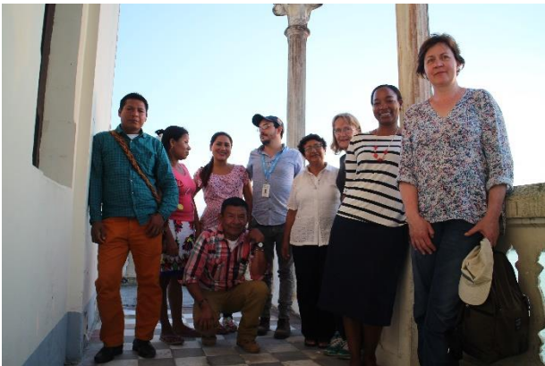
LML:n hankkeen toimijoita Chocossa